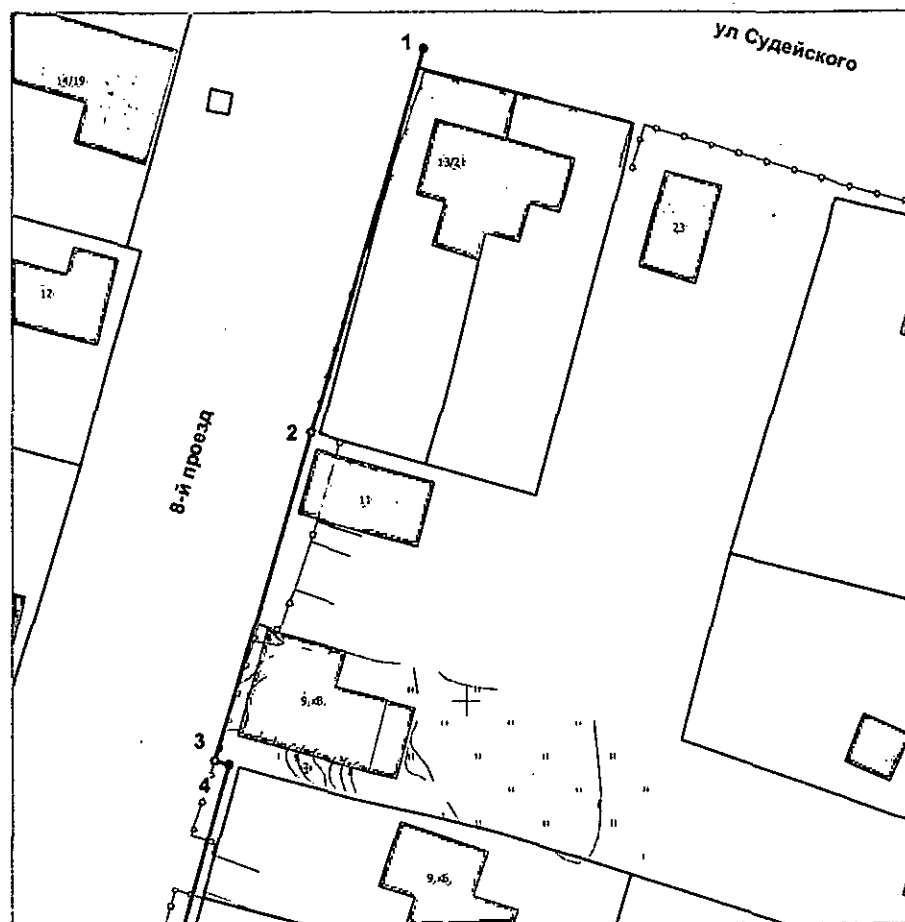
Ведомость координатных точек